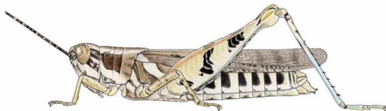
Criotocatantops pulchripes femelle, d'après Mestre (1988)

Catantops pulchripes Karny, 1915, p. 140-141 Holotype mâle, Guinée, Dubréka, NM Vienne