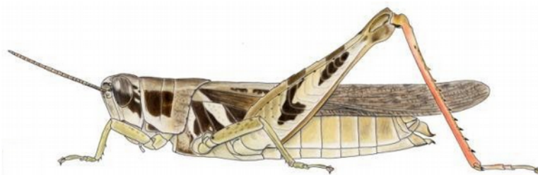
Catantops stramineus femelle, d'après Mestre (1988)

Holotype femelle, Bénin, Whydah, NHM Londres