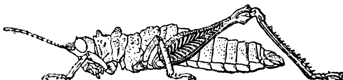
Barombia tuberculosa d'après Karsch (1891)

Syntypes mâle, femelles, Cameroun, Barombi-Station, MNHU Berlin (DORSA 2007 : 3 syntypes, 1 mâle et 2 femelles, l'une d'elle indiquée mâle par erreur ; Karsch cite bien 1 mâle et 2 femelles donnant d'ailleurs une fourchette de taille du corps pour les femelles).