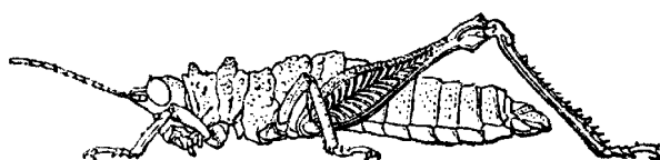
Barombia tuberculosa d'après Karsch (1891)

Syntypes mâle, femelles, Cameroun, Barombi-Station, MNHU Berlin (DORSA 2007 : 3 syntypes, 1 mâle et 2 femelles, l'une d'elle indiquée mâle par erreur ; Karsch cite bien 1 mâle et 2 femelles donnant d'ailleurs une fourchette de taille du corps pour les femelles).