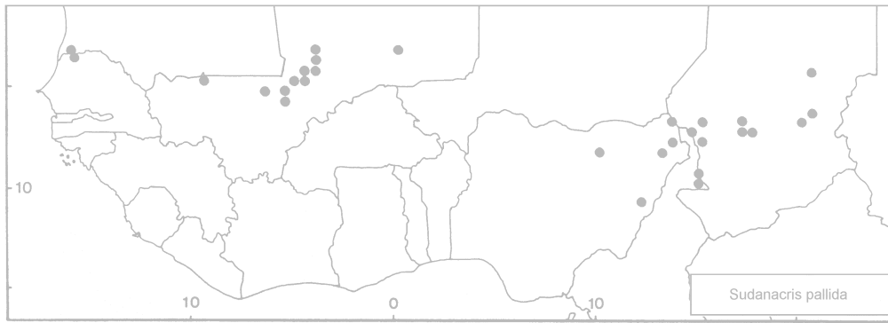
La signalisation de Gambie (Mestre & Chiffaud, 1997) est une erreur. L'espèce est également signalée du Soudan.